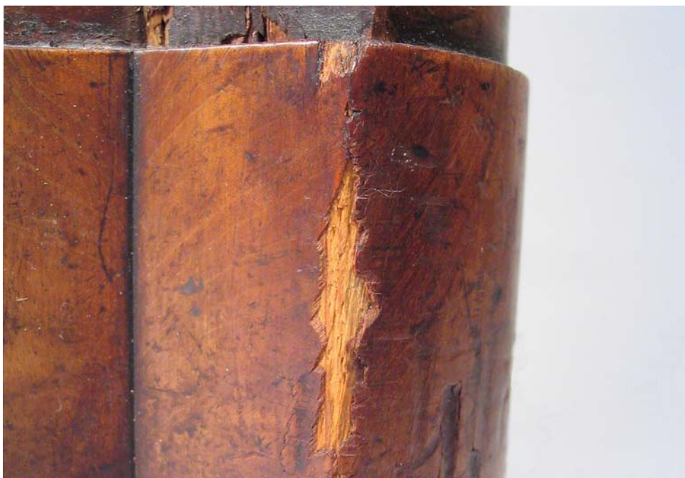
Abb. 2: Heraus gebrochene Furnierstücke am rechten Vorderfuß