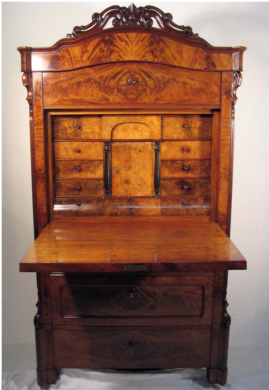
Abb. 11: Aufgeklappter Sekretär Endzustand

Die gesamte Oberfläche wurde mit Terpentinöl von Fett und Schmutz gereinigt. Anschließend wurde die alte Politur mit einem Schellack getränkten Ballen regeneriert.