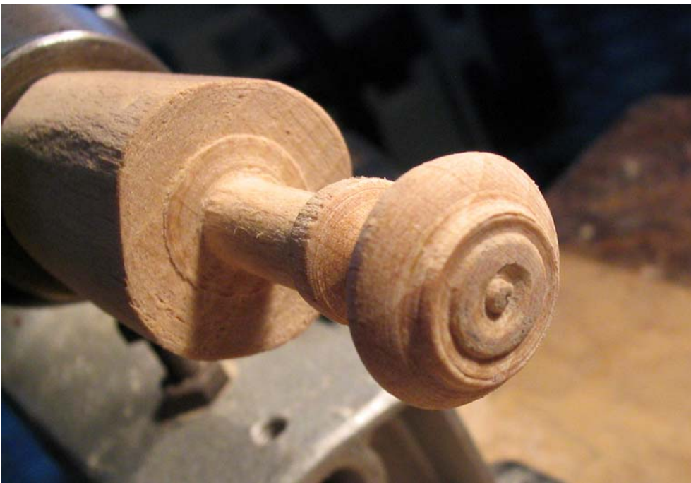
Abb. 8: Ausgearbeiteter Knopf