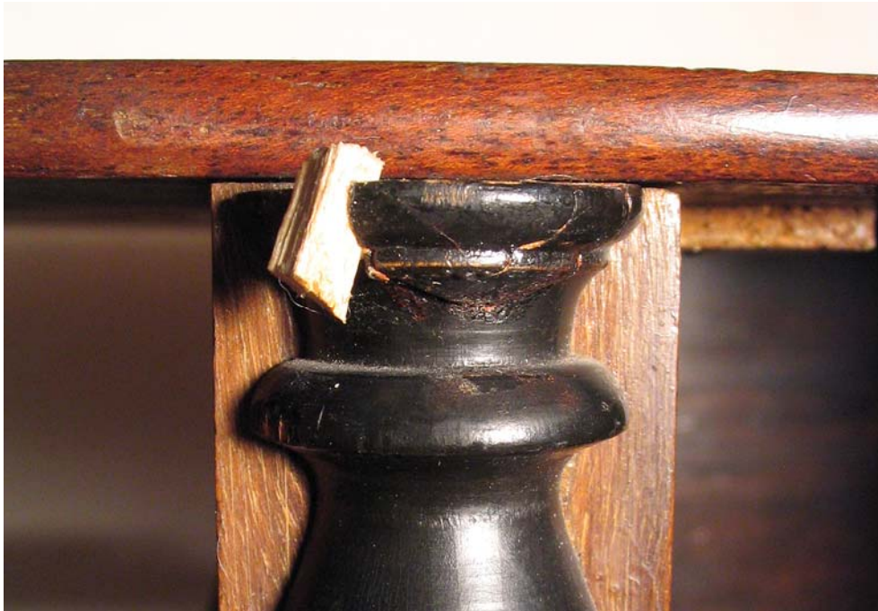
Abb. 6: Eingesetzter Erlenkeil am linken Säulenkopf

Der fehlende Schubladenknopf des Innenteils wurde gedrechselt. Hierfür wurde ein quadratisches Buchenstück mittig gedübelt und rund gehobelt. Die Knopf- form konnte nun mit Drechseleisen aus diesem Stück ausgearbeitet werden (s. Abb. 7 und 8). Der fertige Knopf wurde mit Mahagoni Wasserbeize gefärbt und mit Schellack ausgezogen.