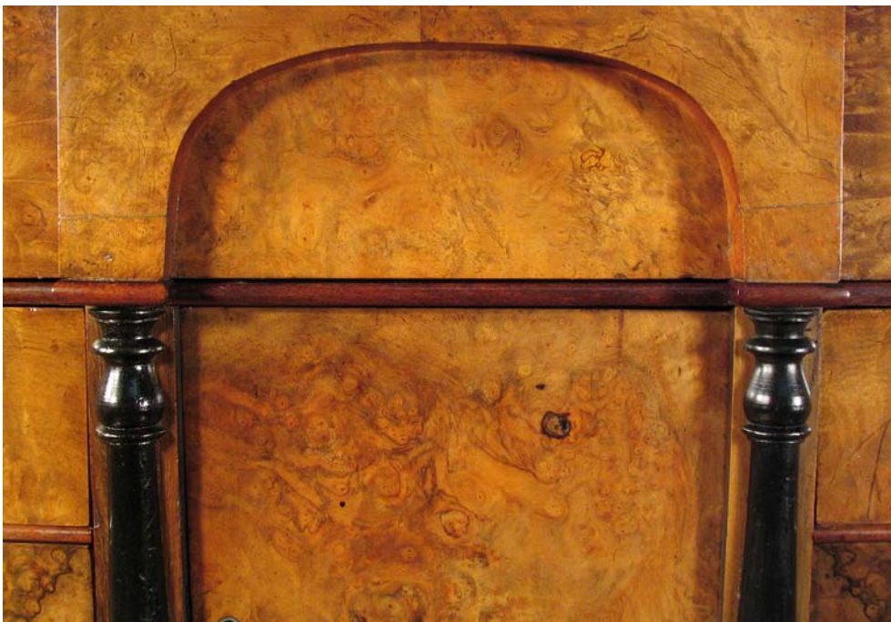
Abb. 10: Endzustand Säulen und Bogen