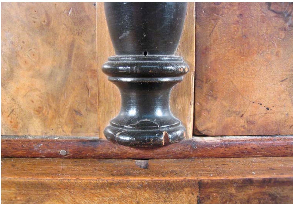
Abb. 5: Fehlende halbrunde Plinte, Fehlstelle am Säulenfuß