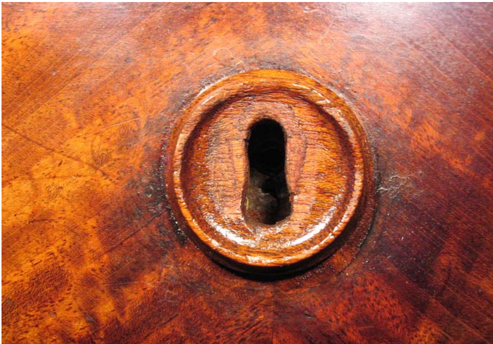
Abb. 9: Ergänzungen am Schlüsselschild, Grundfarbe