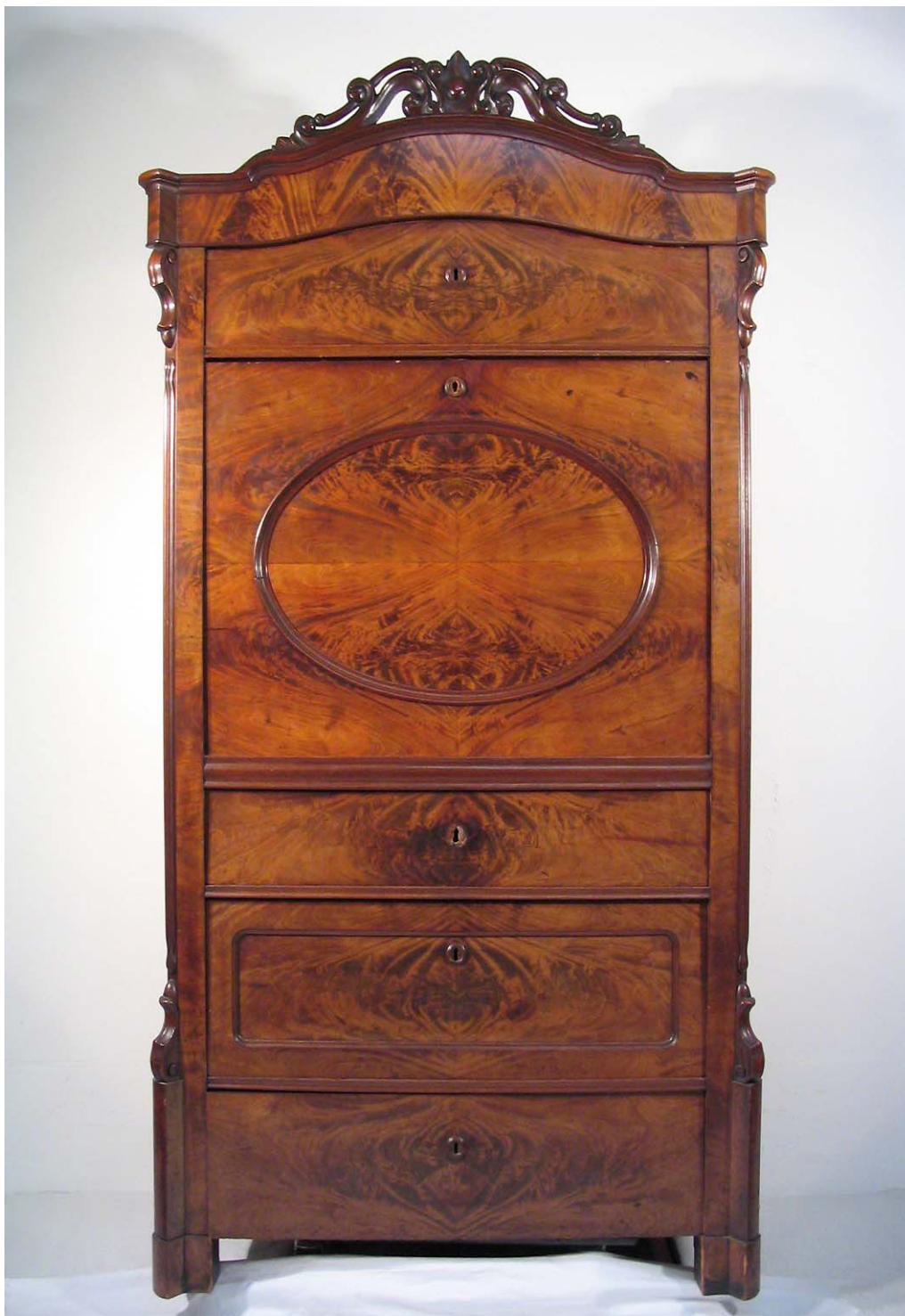
Abb. 1: Gesamtansicht Front, Zustand vor der Restaurierung