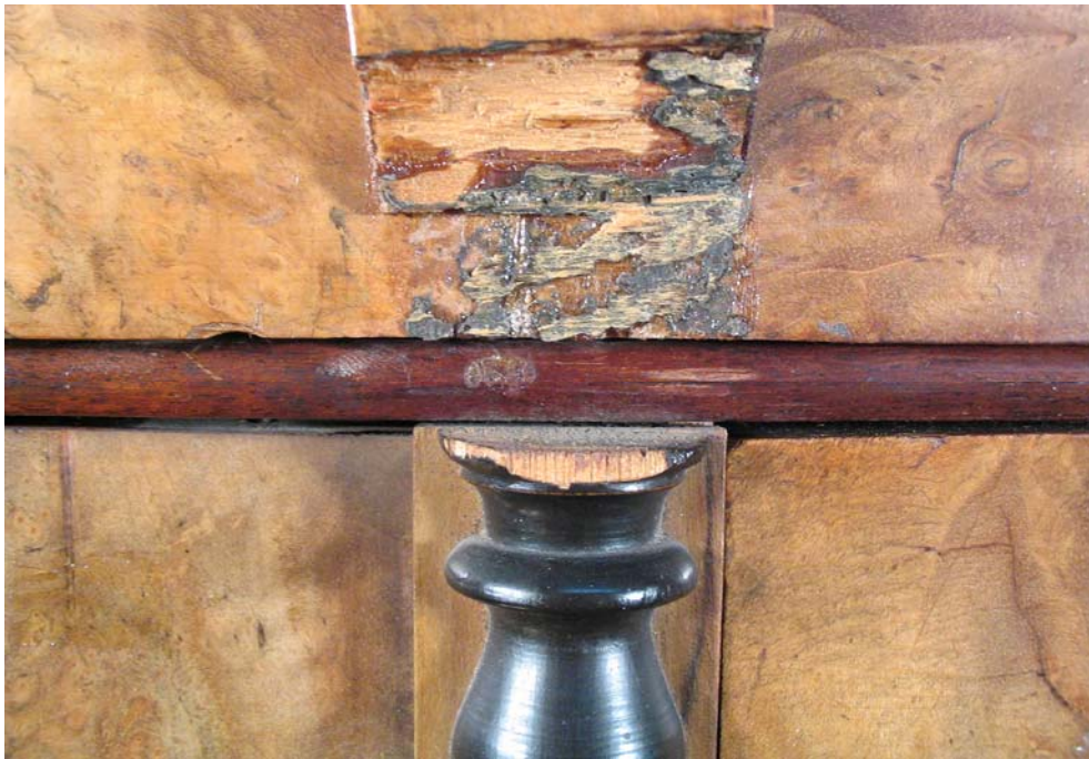
Abb. 4: Heraus gebrochene Fehlstelle an Bogen und Säule